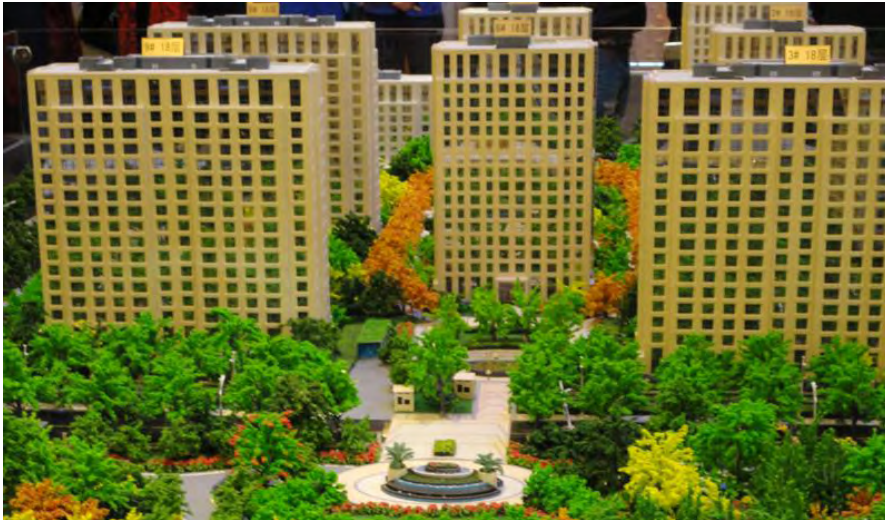
Modell von „Jin Mao Palace“ Beijing. Die Wohnanlage wird nach Fertigstellung über 110.000m 2 Kapillarrohrmatten temperiert.

Zum ersten Mal in seiner Geschichte beliefert BEKA ein einzelnes Projekt mit 6-stelliger Quadratmeterzahl.