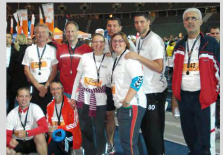
BEKA-Läufer im Berliner Olympiastadion

Tatsächlich entwickelten sich einige Mitarbeiter in dieser Zeit von absoluten Anfängern zu passionierten Läufern, die sogar schon auf den Marathon schielen.